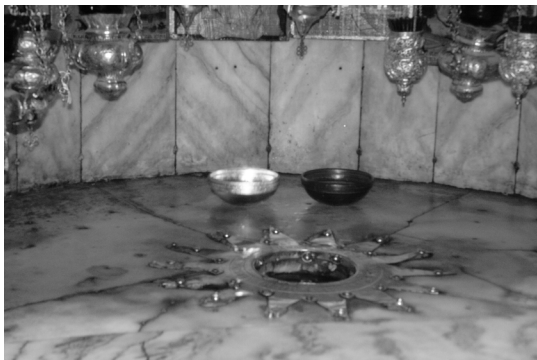
Hviezda označujúca miesto Ježišovho narodenia. Jej štrnásť cipov symbolizuje štrnásť generácií v rodokmeni Matúšovho evanjelia a rovnako poukazuje na štrnásť zastavení krížovej cesty.

spočinuli jeho nohy“, zanechala aj nasledujúcim pokoleniam plody svojej zbožnosti. Postavila Bohu, ktorého uctievala, dva chrámy – jeden pri jaskyni Narodenia Pána v Betleheme, druhý na Hore Nanebovstúpenia.“