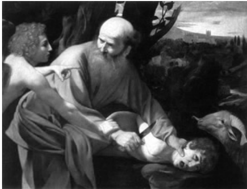
Caravaggiov obraz Obetovanie Izáka

Keď pozeráme na príbeh obetovania Izáka iba ľudskými očami, Boh sa nám javí ako tvrdý a krvilačný. Na vrchu Morja však Abrahámová viera prechádza skúškou očisťovania. Mnohé v nej zaniklo - to „priveľmi ľudské“ v nej. Na vrchu Morja sa Abrahámová viera stala zrelšou, pokornejšou, lebo sa oprela o toho, ktorý je všetkého základom.