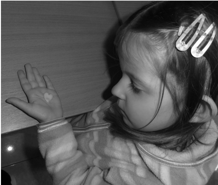
jesenné Tvorivé dielne